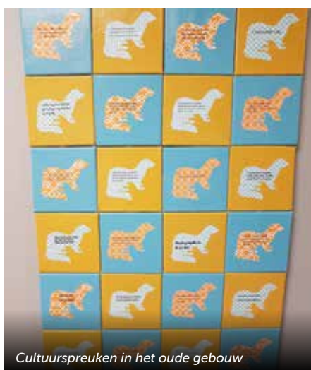
Cultuurspreuken in het oude gebouw

Gedurende het jaar voeren zij ook controle uit op de eigen fabriek en alle leveranciers. Zo zorgen zij ervoor dat alle materialen die we inkopen ook daadwerkelijk die kwaliteit hebben die we verwachten. Het onderdeel regelgeving van deze afdeling is verantwoordelijk voor het handhaven van alle binnenlandse en buitenlandse productregistraties, evenals de productmasterdossiers, die de geschiedenis van elk product omvatten. Sommigen dateren al van de zestiger, zeventiger of tachtiger jaren. Natuurlijk heeft United ook een Human Resource (HR) en een Financiële afdeling. Beiden bestaan uit 3 personen. Wat zij doen spreekt voor zich. De HR afdeling (3 personen) zorgt ervoor dat nieuwe werknemers met plezier probleemloos van start kunnen en ook graag binnen het bedrijf willen blijven werken in plaats van verder te gaan. Het maken van vaccin vergt ongelooflijk veel structuur en accuratesse. De kleinste fout kan fataal zijn en een hele batch verpesten met grote financiële gevolgen. Door de jaren heen is veel personeel gekomen en gegaan maar inmiddels heeft men een vaste groep goed gekwalificeerde en gemotiveerde medewerkers. De afdeling Financiën heeft natuurlijk de laatste jaren veel extra werk gehad met de financiering voor en de financiën rondom de nieuwe fabriek en erg moeten schipperen met haar budgetten. Een zware opgave!