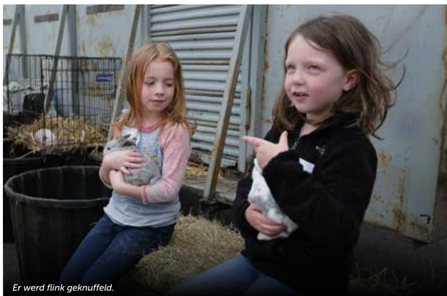
Er werd flink geknuffeld.