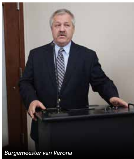
Burgemeester van Verona