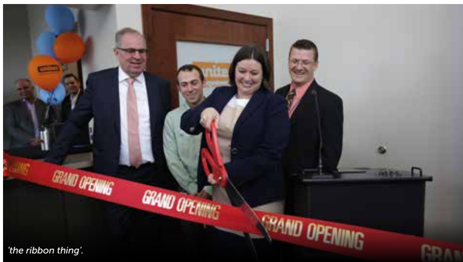
'the ribbon thing'.

aangedragen. Onder luid applaus wordt met een big smile door de directeur het lint doorgeknippt waarmee de fabriek officieel geopend is.