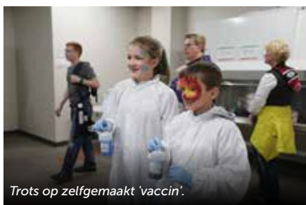
Trots op zelfgemaakt 'vaccin'.