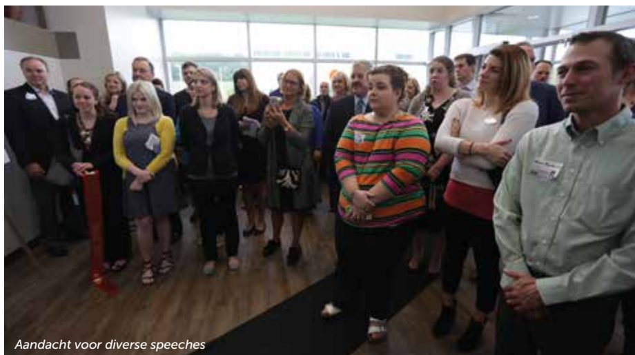
Aandacht voor diverse speeches

groot verschil gemaakt. Daarbij niet in de laatste plaats onze shareholders/klanten die in ons geloofden toen anderen dat (nog) niet deden. Zij zijn geweldig! Zij hebben de basis gelegd.