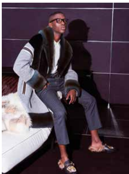
THE FASHION LOOK 2

LISKA green Mink Jacket BEWITCHED COUTURE BY NYNX FLANAGAN musquash fur carriage rug REBECCA BRADLEY LONDON fox cushion