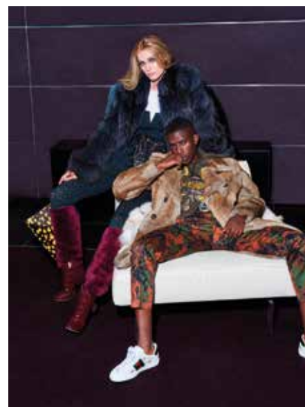
THE FASHION LOOK 3

ASTRID ANDERSEN IN COLLABORATION WITH KOPENHAGEN FUR 'Drake' jacket SAINT LAURENT trousers REBECCA BRADLEY LONDON fox cushion