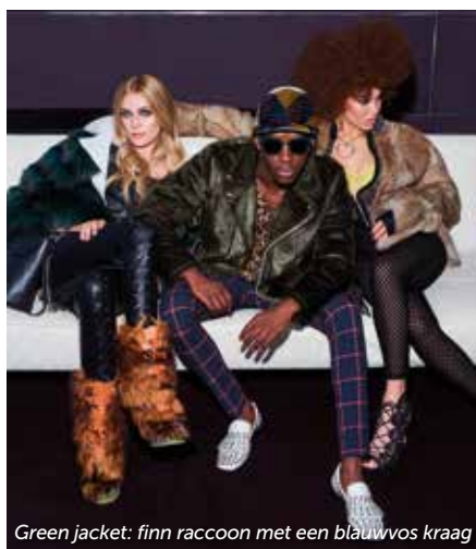
Green jacket: finn raccoon met een blauwvos kraag