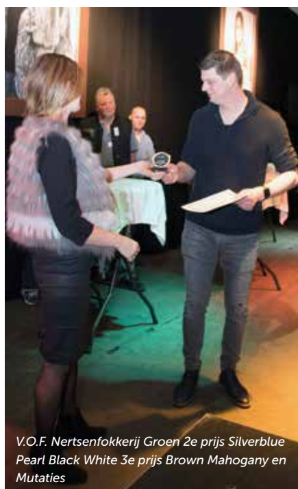
V.O.F. Nertsenfokkerij Groen 2e prijs Silverblue Pearl Black White 3e prijs Brown Mahogany en Mutaties