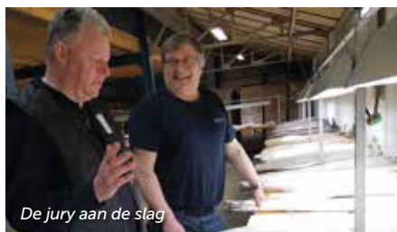
De jury aan de slag