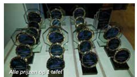
Alle prijzen op 1 tafel