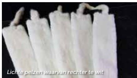
Lichte pelzen waarvan rechter te wit