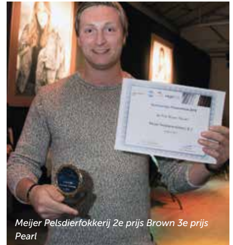
Meijer Pelsdierfokkerij 2e prijs Brown 3e prijs Pearl