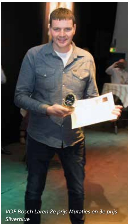
VOF Bosch Laren 2e prijs Mutaties en 3e prijs Silverblue