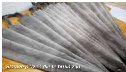
Blauwe pelzen die te bruin zijn