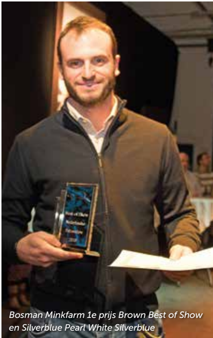
Bosman Minkfarm 1e prijs Brown Best of Show en Silverblue Pearl White Silverblue