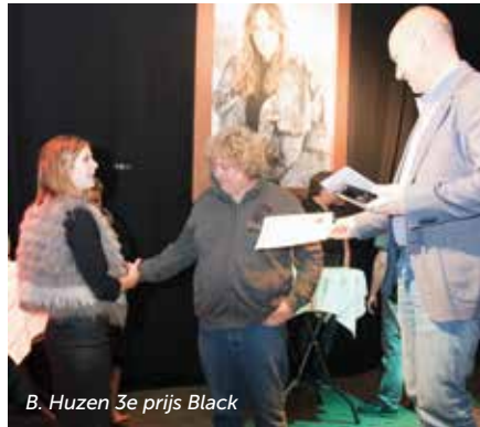
B. Huzen 3e prijs Black