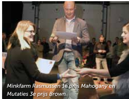
Minkfarm Rasmussen 1e prijs Mahogany en Mutaties 3e prijs Brown