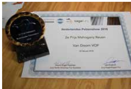
Nederlandse Pelzenshow 2018 2e Prijs Mahogany Reuzen Van Doorn VOF 2018-2019