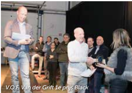
V.O.F. Van der Grift 1e prijs Black